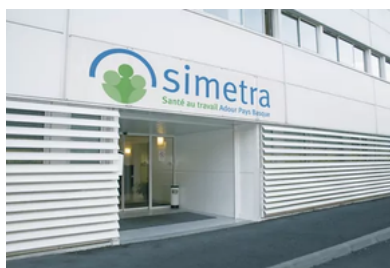
CENTRE MÉDICAL "DONZACQ" 38, CHEMIN DE SABALCE 64100 BAYONNE