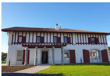
CENTRE MÉDICAL "LARRESSORE" MAISON GUTIBARATZEA 444, RUE INTHALATZECO BIDEA 64480 LARRESSORE