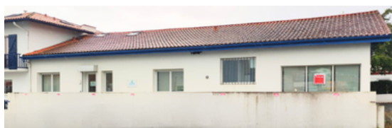
CENTRE MÉDICAL "SAINT-JEAN-DE-LUZ" 6, AVENUE DE LAYATS 64500 SAINT-JEAN-DE-LUZ