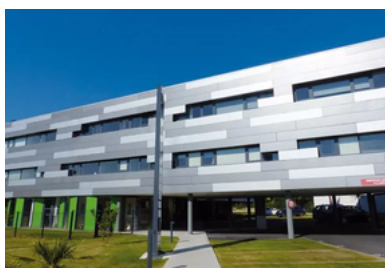
CENTRE MÉDICAL "BIARRITZ" BÂTIMENT « LE RÉCIF », 26, ALLÉE MARIE POLITZER 64200 BIARRITZ