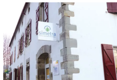
CENTRE MÉDICAL "ISPOURE" VILLA ALHASTEANIA CD933 64220 ISPOURE