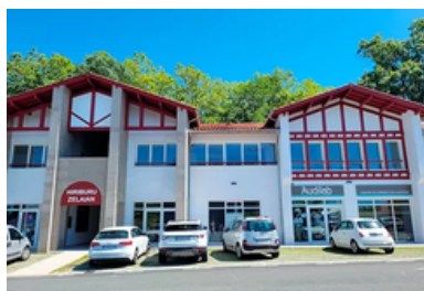
CENTRE MÉDICAL "SAINT-PIERRE-D'IRUBE" RÉSIDENTICE HIRIBURU ZELAIAN, 1ER ÉTAGE – PORTE B 1.2 10, ALLÉE BORDENAVE 64990 SAINT-PIERRE-D'IRUBE